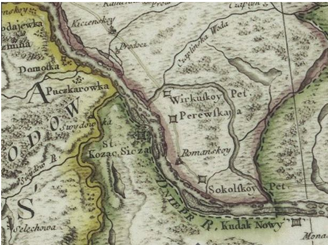
Мал. 3. Зображення укріплення «St. Kozac. Sicza» (Стара Козацька Січ) на мапі італійця Річчі Заноні (фрагмент)

винесеними вперед охоронними бекетами [3, с. 55-56]. Це дуже смілива заява, але не безпідставна, вона поки що носить гіпотетичний характер і для її доведення слід віднайти і опрацювати відповідні джерела.