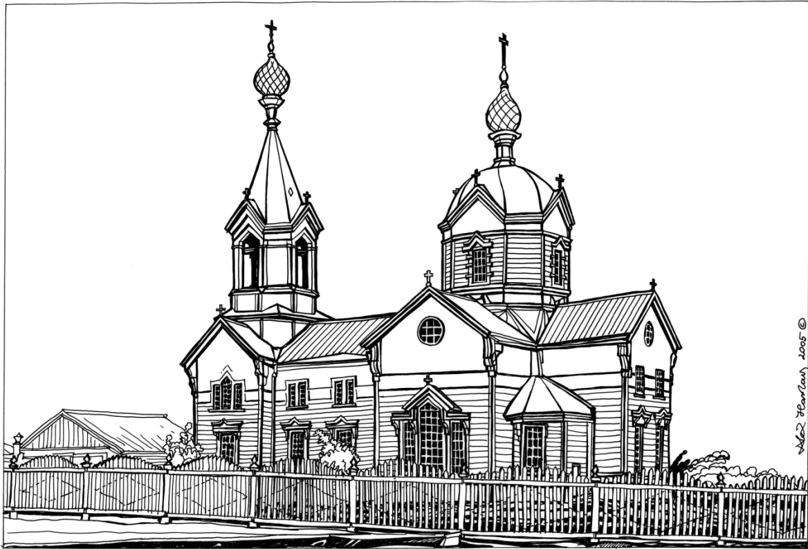
Мал. 5. Зовнішній вигляд останньої дерев'яної Свято-Успенської церкви в Романковому. (За матеріалами Дніпродзержинського краєзнавчого музею (прорис автора (2005 р.), за виданням Буланова Н. Земні силиети віри. Історія церков Кам'янського (Дніпродзержинська). – Д., 2000. – С. 27)).

В четвертій дерев'яній церкві – на честь Успіння Божої Матері – богослужіння було розпочато у 1894 р. [12, с. 175-176]. Вона була 3-х престольна. Другий престол на честь святителя Миколая, а третій – на честь апостола Андрія Первозваного.