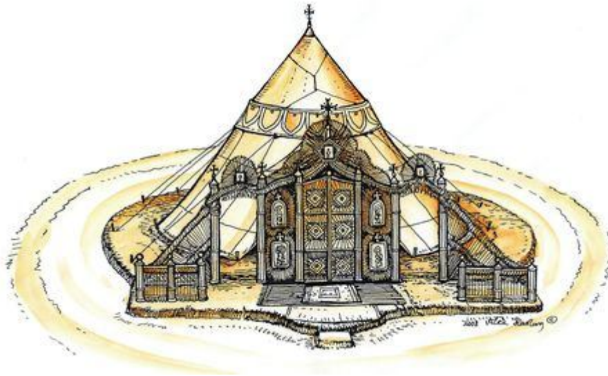
Мал. 1. Похідна церква на Романковому кургані в розібраному стані «в середині намету», підготовлена для проведення служби. Малюнок-реконструкція автора (2008 р.)

Відомо, що перша церква була пересувна, влаштована на колесах і ззовні схожа «на хлівину», невисока, з малими вікнами і крихітними шпильми на даху. Нами була виконана гіпотетична реконструкція зазначеного мобільного храму [13, с. 282-287; 14, с. 179-189; 15, с. 291-300]. Її зовнішній вигляд в зібраному і розібраному вигляді наводимо нижче (мал. 1, 2). Невідомо до якого часу дана церква існувала в с. Романково, також невідома доля цієї мобільної споруди.